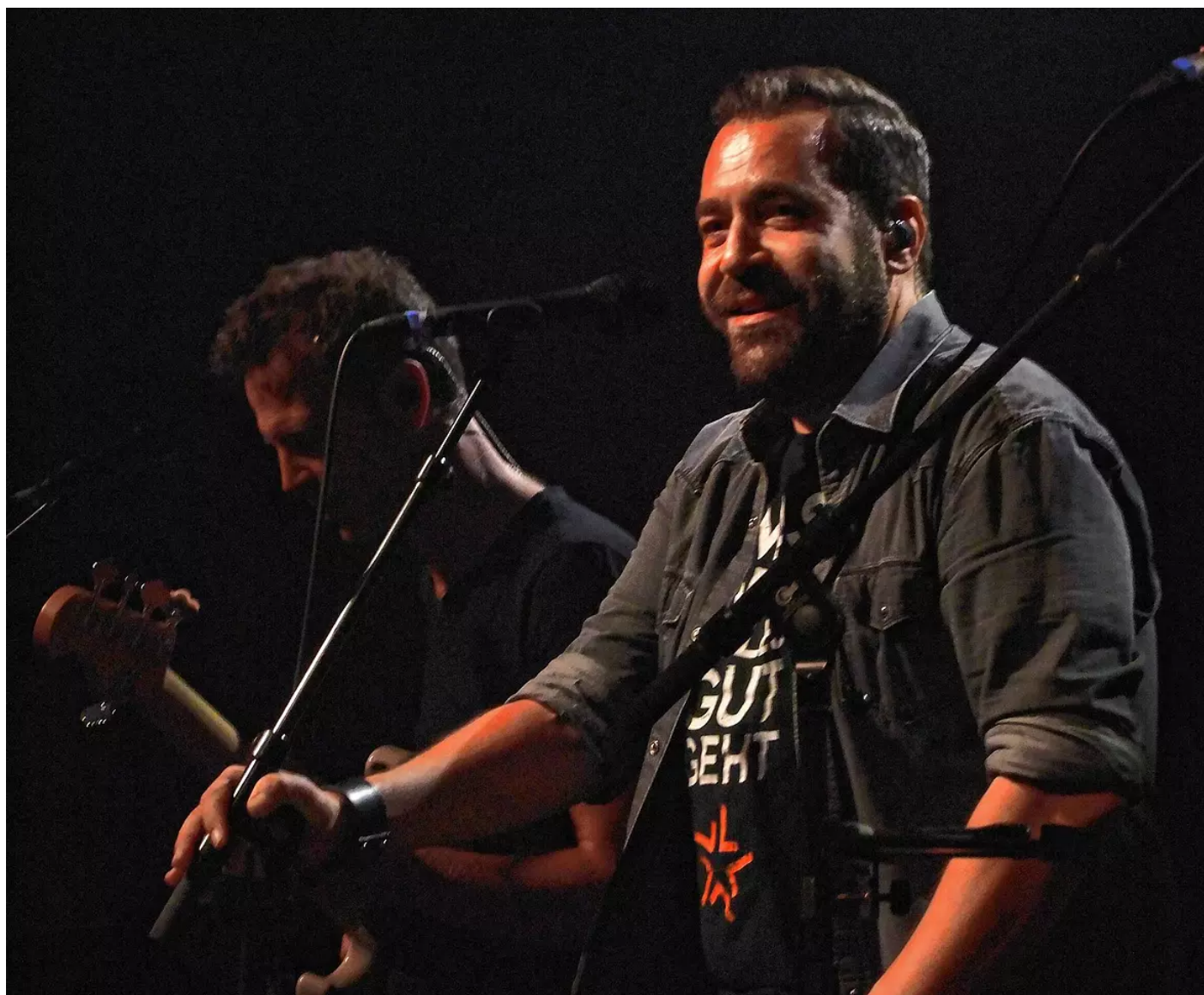
Laith Al-Deen bei seinem Auftritt im Milchwerk Radolfzell im Jahr 2018.

Der deutsche Sänger Laith Al-Deen wurde im Jahr 2000 mit dem Song „Bilder von dir“ bekannt. Und er kennt Radolfzell schon: 2018 war er einer der Künstler beim ersten Milchwerk-Festival.